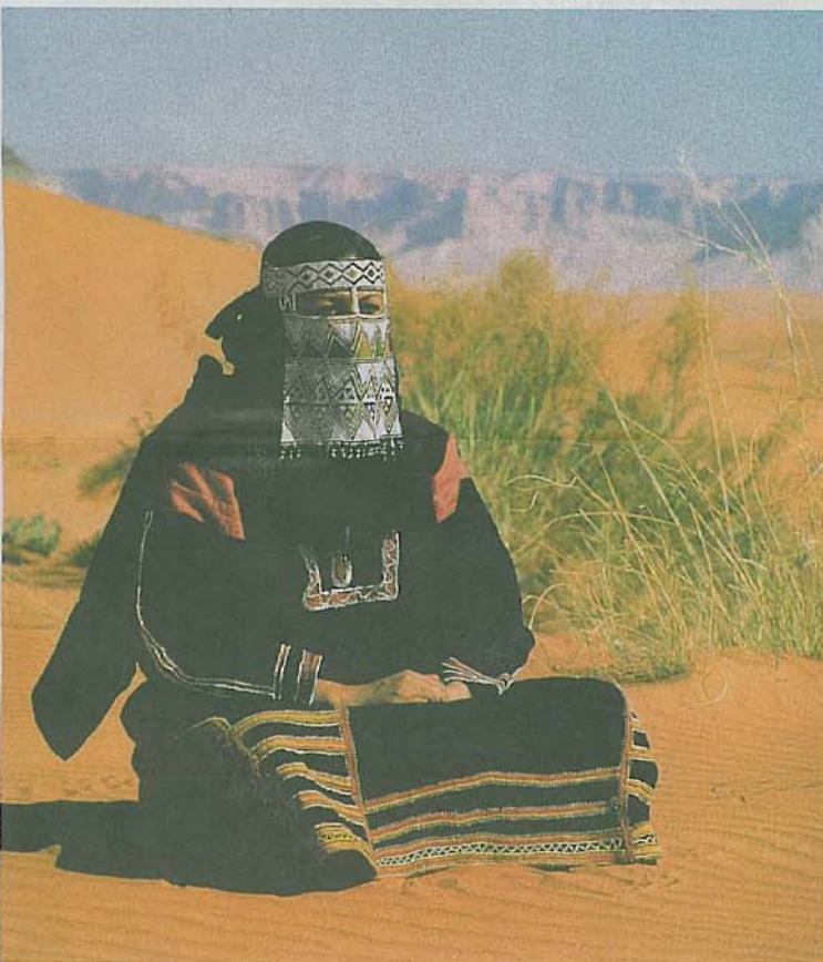
Arabische Impressionen: Verschleierte Frau, die antike rosarote Nabatäer-Stadt Madain Saleh, die an Petra in Jordanien erinnert (re.). Moschee in der Hafenstadt Dschidda