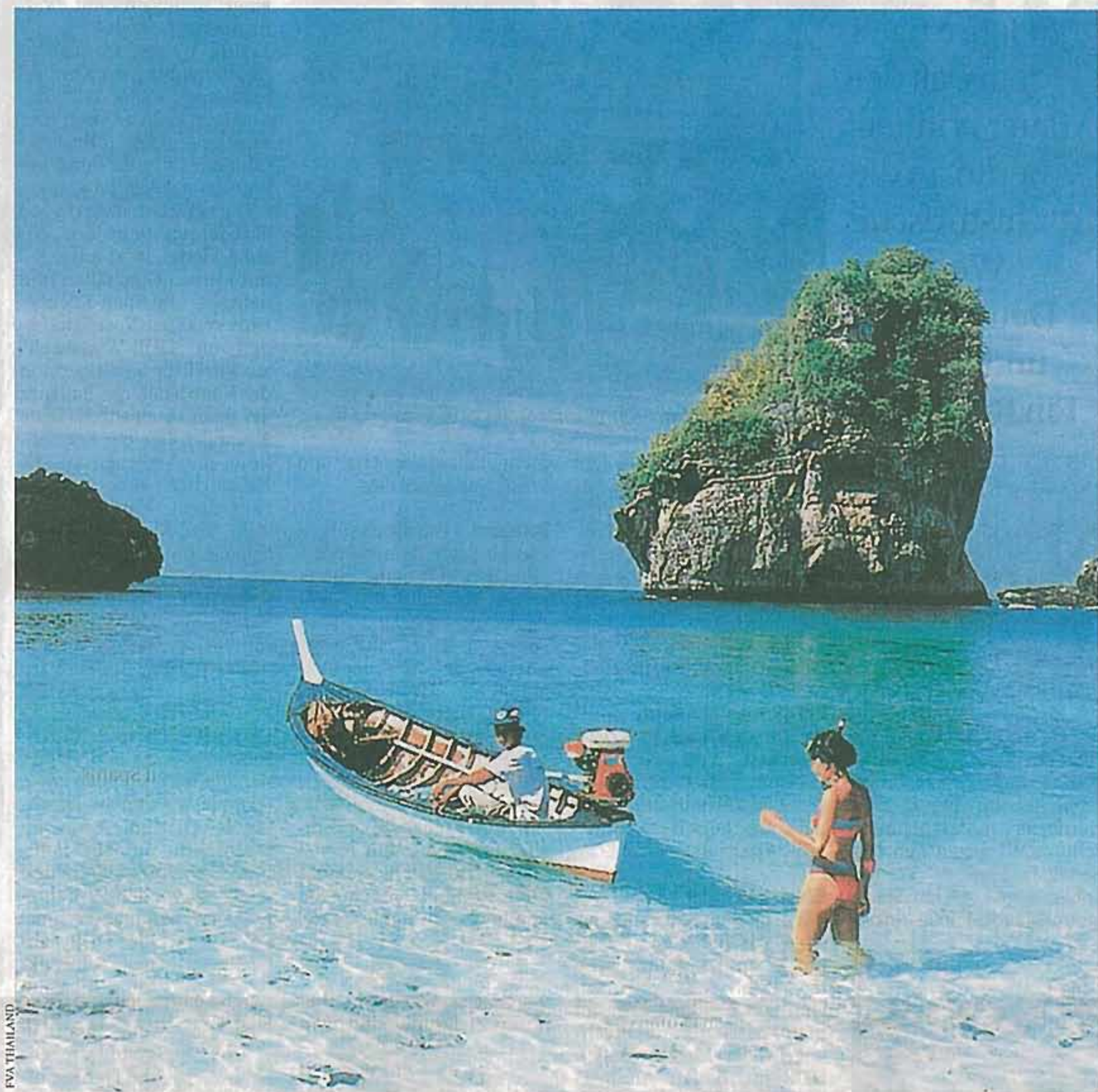
Ruhe im Paradies: Thailands Strände und Hotels sind halb leer. Seit der Flughafenbesetzung in Bangkok bleiben die Gäste aus