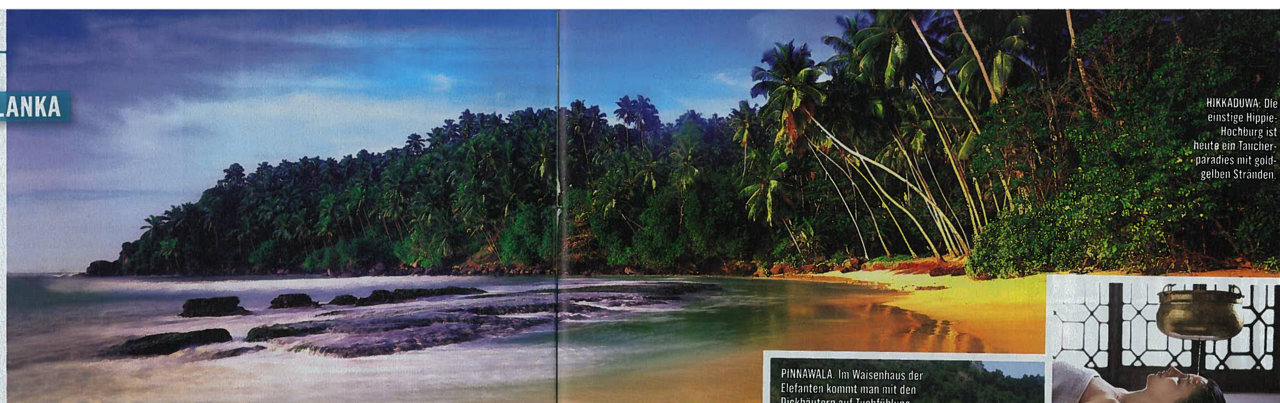
HIKKADUWA: Die einstige Hippie-Hochburg ist heute ein Taucherparadies mit goldgelben Stränden.

VON NORDEN NACH SÜDEN. Von den historischen Stätten rund um Habarana geht's zu den malerischen Strandorten im Südwesten.