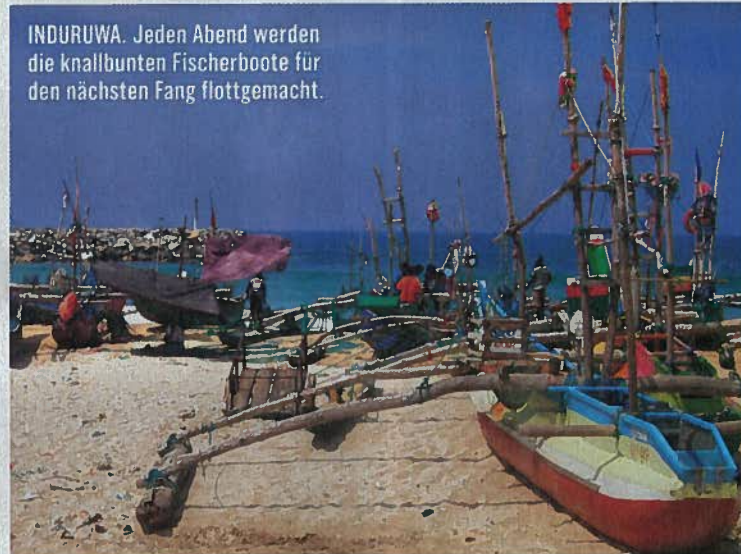
INDURUWA. Jeden Abend werden die knallbunten Fischerboote für den nächsten Fang flottgemacht.

Weg. Das regierungseigene Waisenhaus für Elefanten in Pinnawala ( www.elephant.se ), in dem mehr als 50 Dickhäuter leben, bietet wahrscheinlich die beste Möglichkeit, die Rüsselträger ganz aus der Nähe zu beobachten. Beim freien Auslauf auf dem 25 Hektar großen Gelände ist die Herde ein imposanter Anblick.