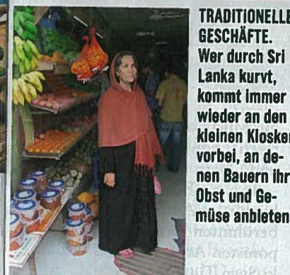
TRADITIONELLE GESCHÄFTE. Wer durch Sri Lanka kurvt, kommt immer wieder an den kleinen Kiosken vorbei, an denen Bauern ihr Obst und Gemüse anbieten.

neun Stunden braucht man mit dem Auto von Habarana an die Südküste. Von Galle bis Negombo erstreckt sich dann die 300 Kilometer lange Küste mit großartigen Stränden und einer ganzen Reihe attraktiver Ferienorte. Pauschalreisende kommen zumeist in die beiden Städtchen Bentota und Beruwala nahe Hikkaduwa.