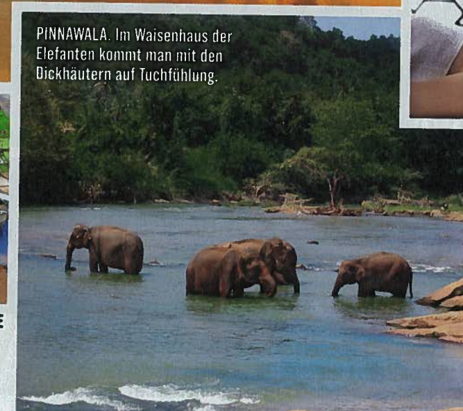
PINNAWALA. Im Waisenhaus der Elefanten kommt man mit den Dickhäutern auf Tuchfühlung.

Ruhiger ist's hingegen in Induruwa, wo tolle Ayurveda-Hotels wie das „Temple Tree Resort“ ( www.templetreeresortandspa.com ) und menschen-