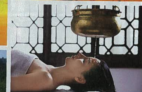
AYURVEDA. In dem kleinen Küstenstädtchen Induruwa gibt's die schönsten Wellness-Hotels. Unser Tipp: das „Temple Tree Resort“.