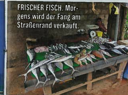
FRISCHER FISCH. Morgens wird der Fang am Straßenrand verkauft.

Sonne, Strand, Meer. Sri Lanka ist klein genug, um an einem Tag vom Norden zu den Strandregionen im Süden zu gelangen. Die Fahrt ist allerdings anstrengend. Knapp